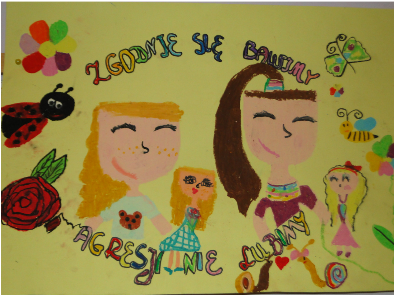
Autorki: Patrycja Sowa i Kaja Sikora uczennice szkoły podstawowej kl. III b