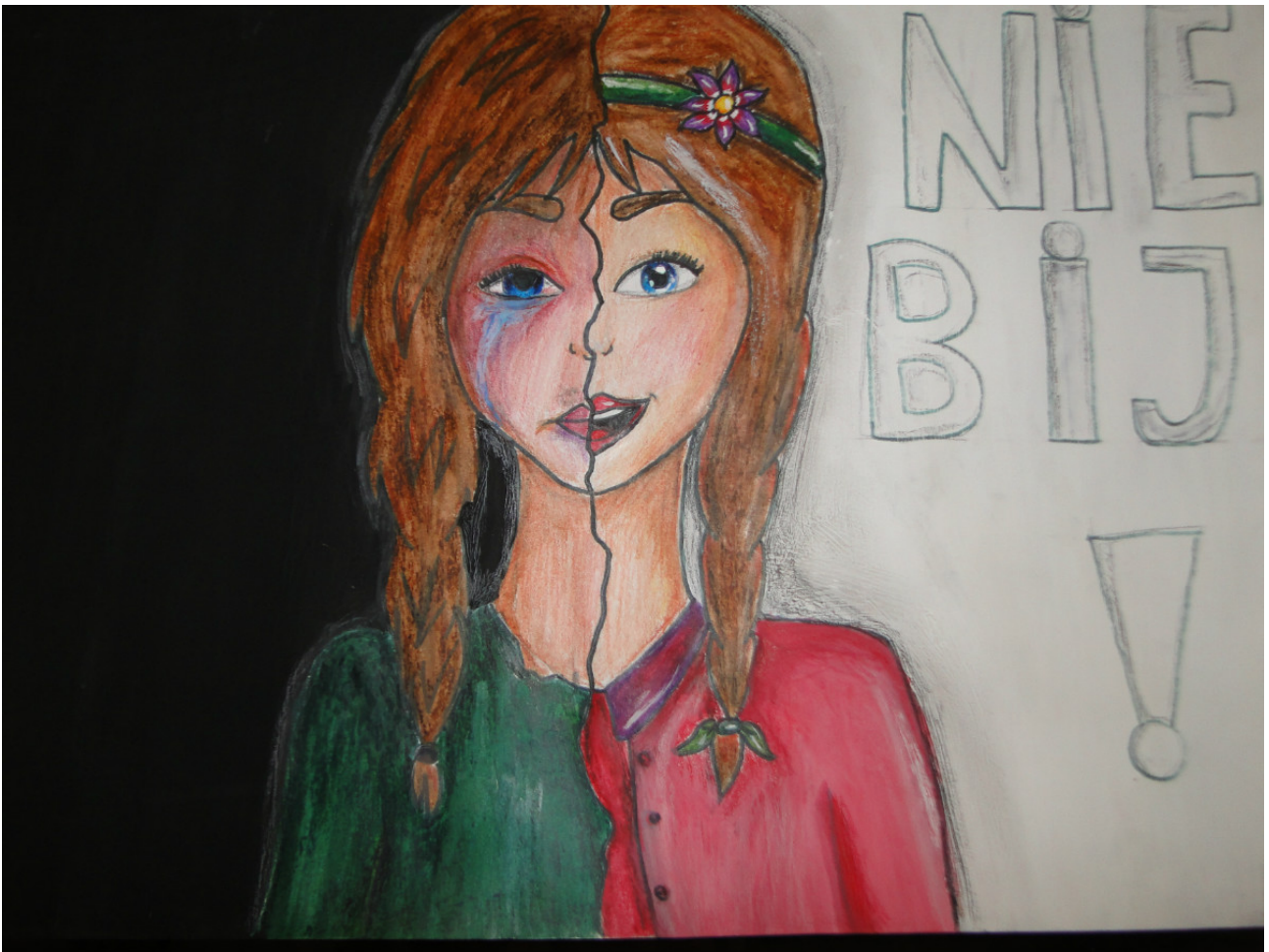
Autor: Seweryn Konopiński uczeń gimnazjum kl. II b